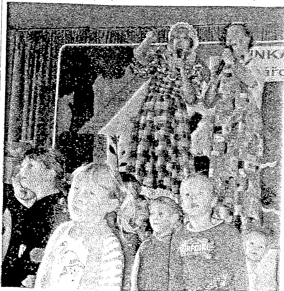
DĚTÍ JAKO SMETÍ. Všechny děti se při akci dobře bavily a užívaly si vtipné vystoupení.

Tato báječná neděle v Ostrovcích se všem velmi líbila, splnila svůj účel a již se všichni těší na 1. března, kdy chceme něco podobného zopakovat.